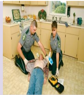
“ON “ AED dan kosong dada