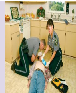
Letakkan pads dan menyambung kabel.