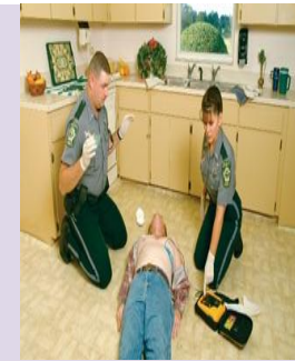
Tekan analyze dan ikuti arahan