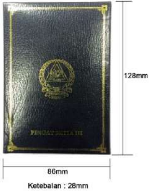
PANDANGAN DARI ATAS