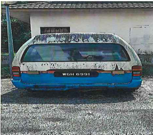
PANDANGAN DARI SUDUT BELAKANG KENDERAAN