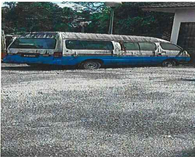
PANDANGAN DARI SUDUT SISI TEPI KENDERAAN