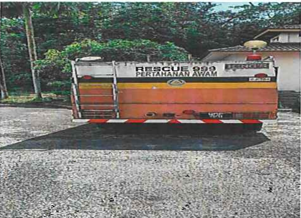
PANDANGAN DARI SUDUT BELAKANG KENDERAAN