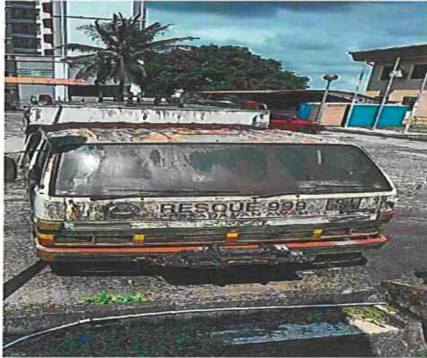
PANDANGAN DARI SUDUT HADAPAN KENDERAAN