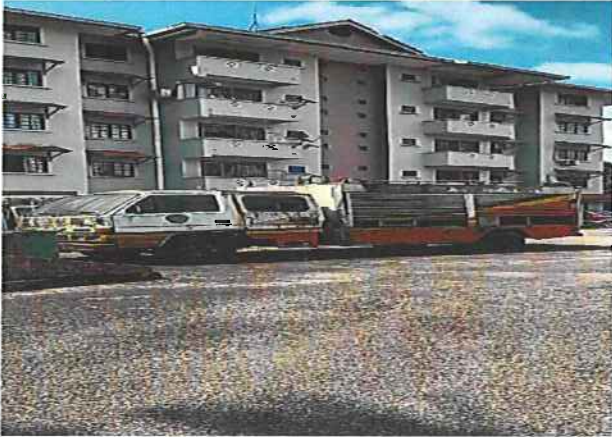
PANDANGAN DARI SUDUT SISI TEPI KENDERAAN