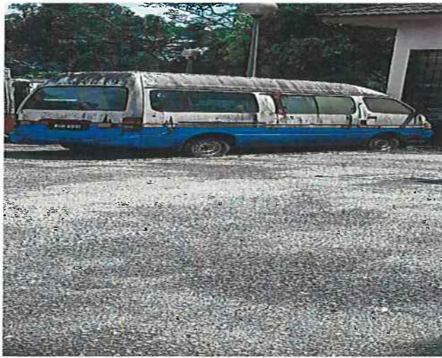
PANDANGAN DARI SUDUT SISI TEPI KENDERAAN