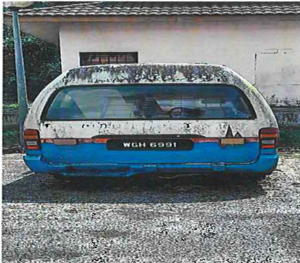
PANDANGAN DARI SUDUT BELAKANG KENDERAAN