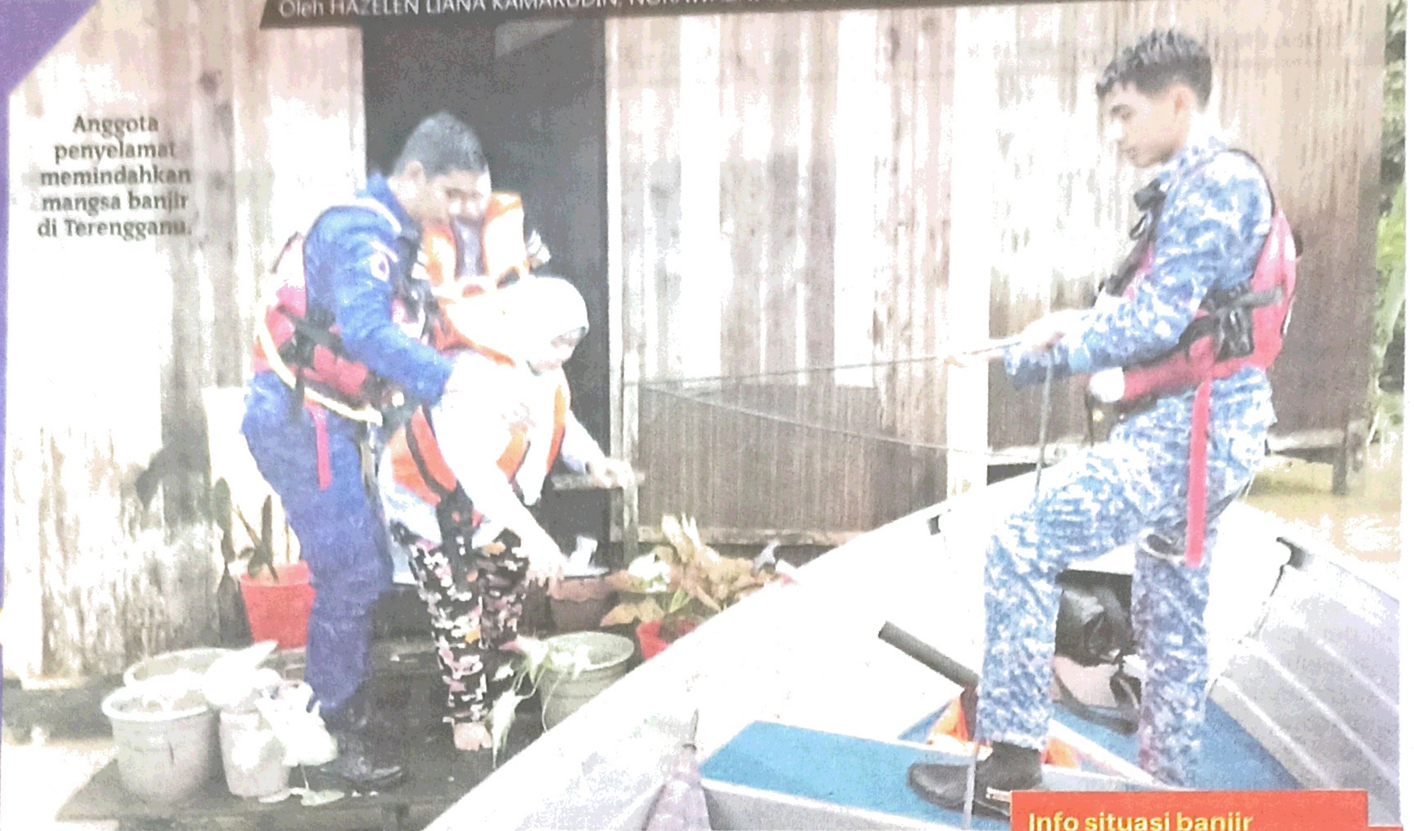
Anggota penyelamat memindahkan mangsa banjir di Terengganu.

Info situasi banjir seluruh negara (Khamis, 25 Januari 2024)