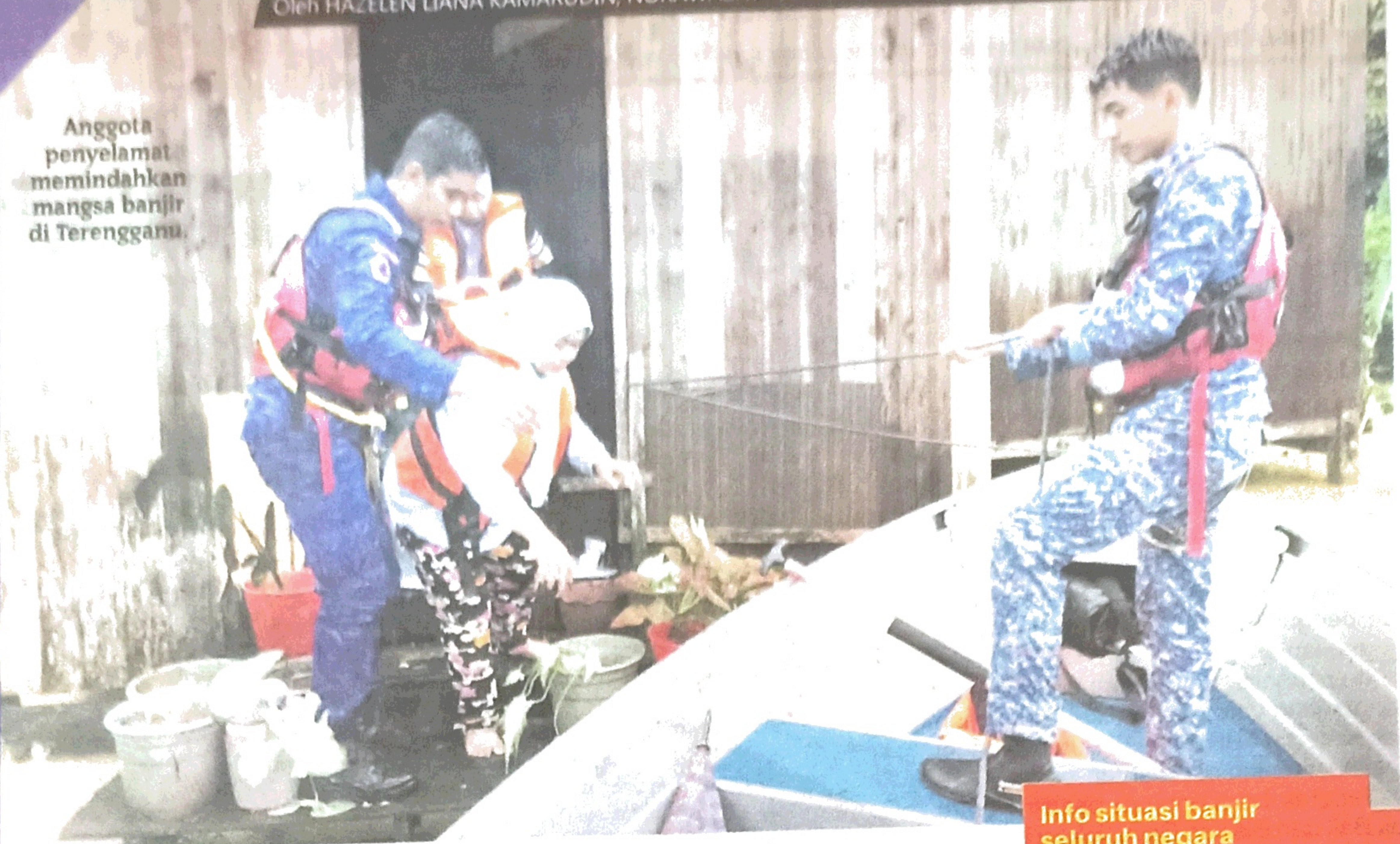
Info situasi banjir seluruh negara (Khamis, 25 Januari 2024)